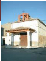
Ermita de San José