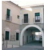
Pasaje de la Encomienda

Situada en el centro-sur de la Mesa de Ocaña, en un lugar donde abundaron las tobas , especie de cardo borriquero, disfruta de un entorno natural de tierras suavemente modeladas por las aguas de arroyos, ricas en flora, fauna, y aderezadas con cuevas, casas de campo y refugios para cazadores.