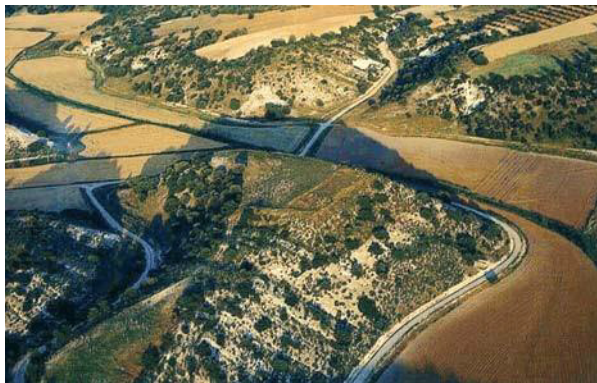
Yacimiento Plaza de Moros