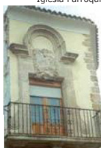
Casa, Plaza Teniente Fernández Carrión

10/ Pozo Rescondo. Pozo del siglo XVIII-XIX que abastecía a los vecinos de la zona. Calle sinuosa y empedrada que responde a la forma de la muralla que bordeaba el municipio.