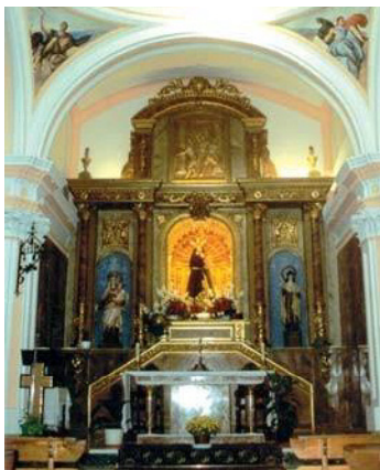
Ermita Jesús Nazareno