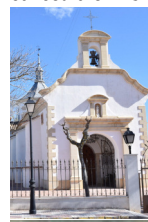
Ermita Jesús Nazareno